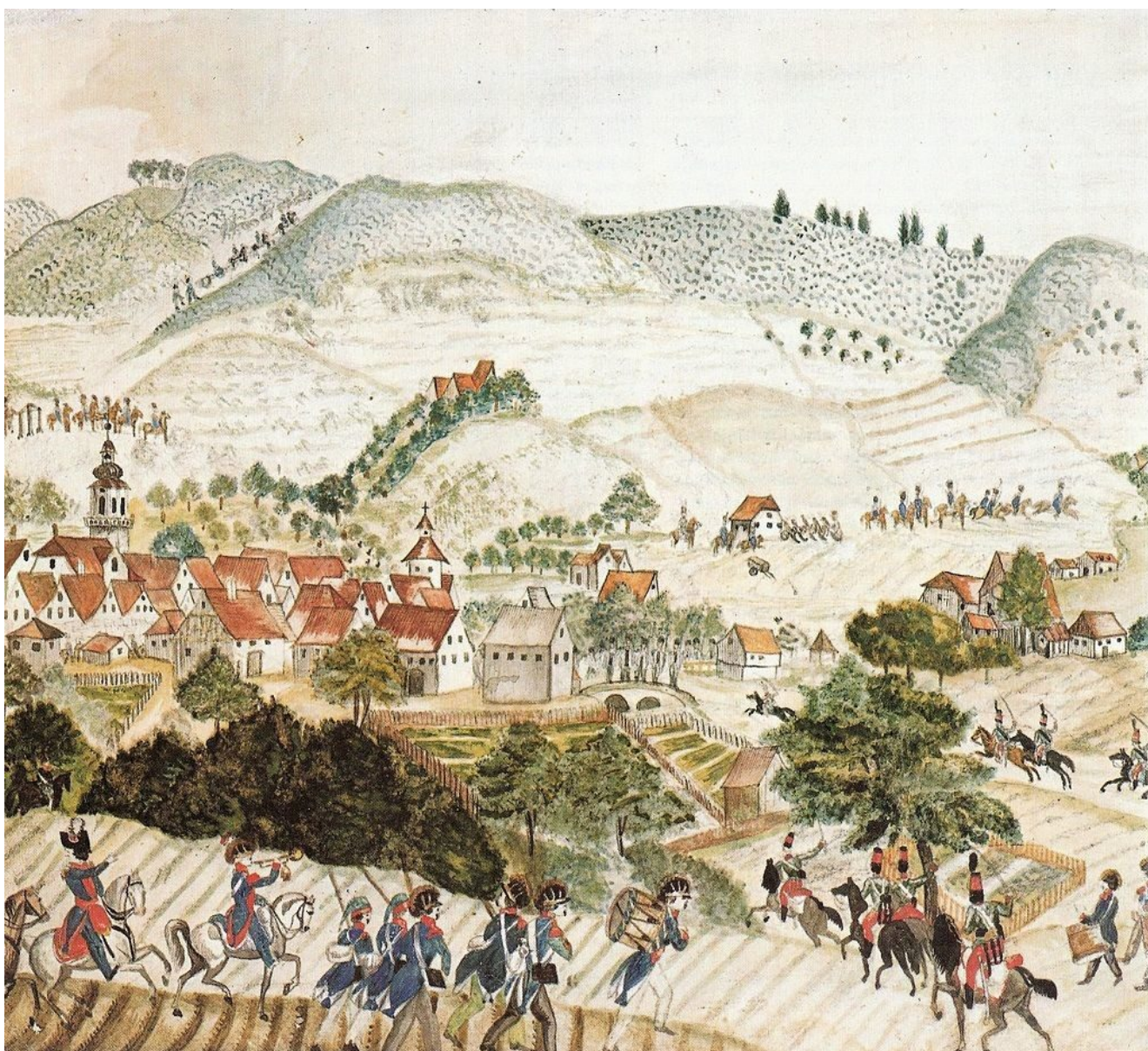
Hyökkäys Aaleniin 1796

Ranskaan. Myös Alankomaat jäi Ranskan vallan alaiseksi ja siitä tehtiin Batavian tasavalta. Ranskan laajenemista vastaan solmitussa ensimmäisessä liittokunnassa olivat mukana Iso-Britannia, Itävalta, Preussi ja Espanja sekä eräitä pienempiä valtioita. Sodan taustalla vaikutti se, että elokuussa 1791 Pyhän saksalais-roomalaisen keisarikunnan keisari Leopold II ja Preussin kuningas Fredrik Vilhelm II antoivat Ranskan vallankumousta vastaan suunnatun Pillnizin julistuksen. Se vahvisti ranskalaisten käsitystä, että muut suurvallat uhkaavat Ranskan vallankumousta ja sen saavutuksia.