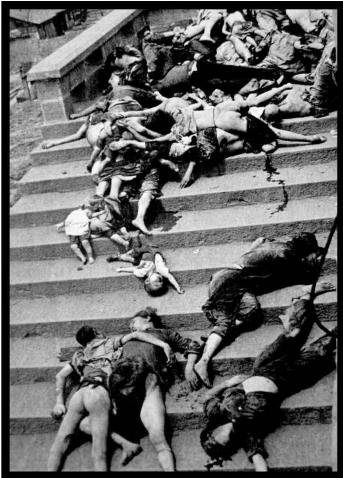
Nanjingin verilöylyn uhreja

yhteistyösopimuksen. Samaan aikaan japanilaiset jatkoivat kiinalaisväestöön kohdistuvia julmuuksia. Kiinalaiset toivoivat, että Tsiang Kai-sek tulisi apuun, mutta hän oli sitoutunut taisteluun kommunisteja vastaan.