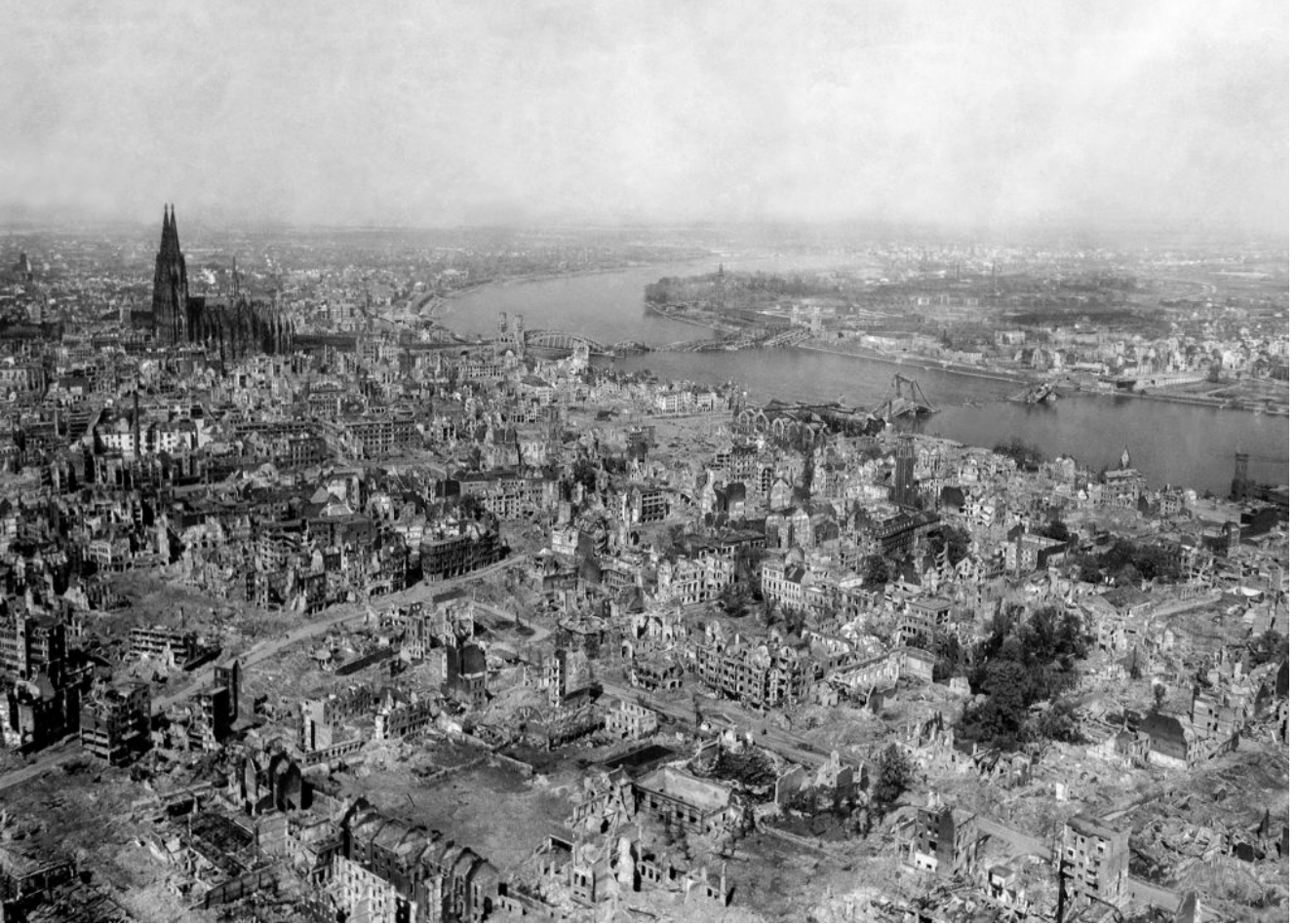
Köln pommitusten jälkeen