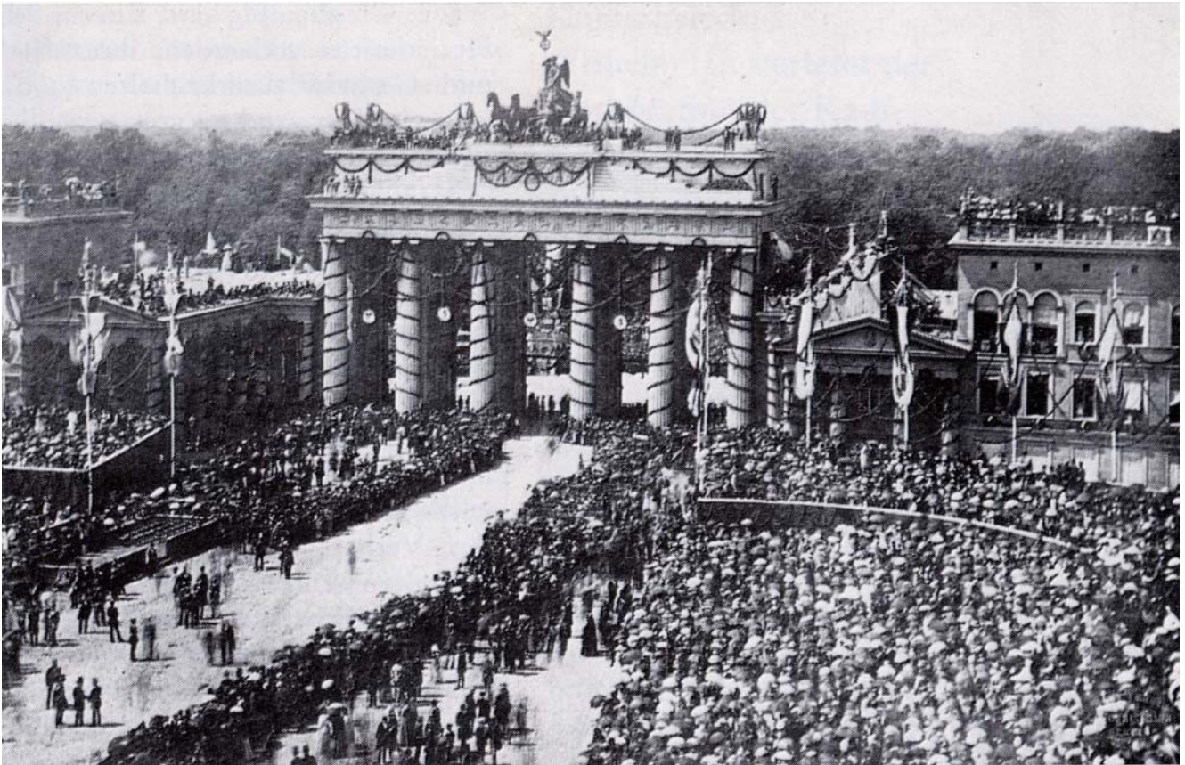
Brandenburgin portti, Saksa juhlistaa voittoa Ranskasta 1871.

Saksan toinen keisarikunta rakennettiin Otto von Bismarckin johdolla, kun joukko ruhtinaskuntia ja pienempiä valtioita yhdistettiin kansallisvaltioksi tammikuussa 1871. Saksan Toinen valtakunta vaikutti Euroopassa 1871-1918 ja sen päämiehenä toimi Preussin kuningas, joka oli mahtava liittoprinssi. Kun pohjois- ja keskisaksalaiset valtiot yhdistyivät, Preussin kuninkaan virkanimitykseksi vakiintui Saksan keisari.